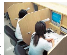
エクステンション講座受講生専用ブース